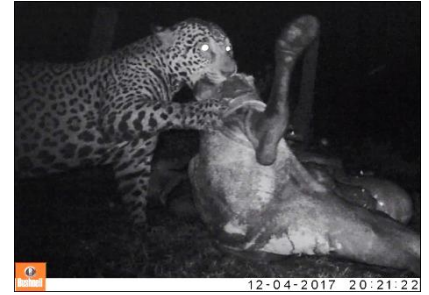
Imagem 05 - Joker em carcaça

Duma 1 , o Joker e um novo macho que foi nomeado de Maui (registrado pela primeira vez ainda filhote em outubro de 2016). Em outra carcaça, apareceram quatro onças: Mion e seus dois filhotes, atualmente com sete a oito meses de idade, nomeados de Filé (macho) e Maminha (sexo indeterminado) e uma quarta onça, uma fêmea adulta que ainda era desconhecida pela equipe, que recebeu o nome de Capoeira .