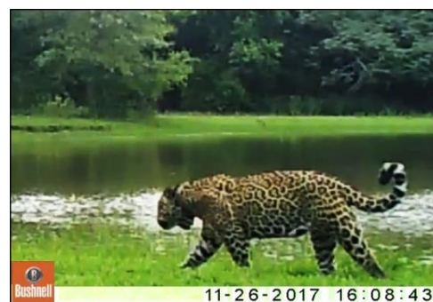
Imagem 02 - Fera passando em frente a AF

Em novembro, 62 armadilhas fotográficas (AF's) da marca Bushnell foram distribuídas por estradas, trilhas, árvores, pontes e manilhas de concreto situadas dentro do Refúgio Ecológico Caiman (REC). Estas foram retiradas do campo em dezembro e seus resultados foram devidamente organizados. Destas, 22 registraram onças-pintadas (56 vídeos) e cinco flagraram onças-pardas ou pumas (05 vídeos). As seis AF's que estavam monitorando as pontes e manilhas não filmaram onças-pintadas. Os