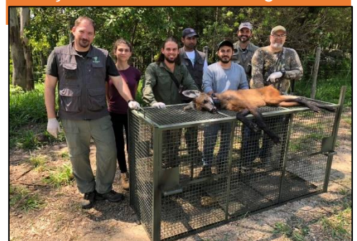
Imagem 04 - Equipe na captura da fêmea adulta de lobo-guará

Entre os dias 05 e 09 de dezembro, um dos biólogos e o veterinário do Onçafari estiveram em uma campanha de captura de lobos-guarás em Mogi Guaçu, interior de São Paulo. Nessa campanha, também estavam a equipe do Projeto Sou Amigo do Lobo e CENAP/ICMBio , além de funcionários que trabalham na propriedade. Nesse período, três indivíduos foram capturados: uma fêmea e suas duas filhotes. A loba adulta teve seu colar substituído por um novo (GPS/VHF). Durante os procedimentos, amostras de sangue e pele, por exemplo, foram coletadas para posterior análise em laboratório. A equipe fez a biometria (medidas corporais) dos animais. Após as capturas, o biólogo do Onçafari permaneceu até o dia 20/12 para o monitoramento dos lobos-guarás. Também foi ministrada uma palestra aos funcionários da fazenda sobre Conservação, Onçafari e sobre os lobos-guarás.