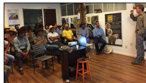
Imagem 09 - Palestra do Onçafari para os peões

Com a transição administrativa no setor da