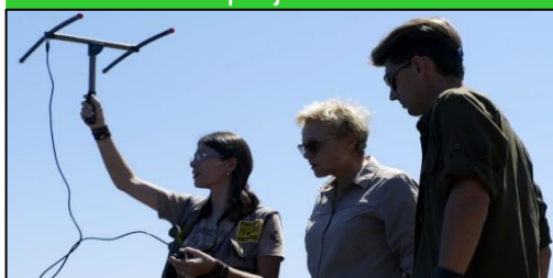
Imagem 08 - Cena do documentário francês

No ano passado, a equipe da emissora Boreales esteve na Caiman e acompanhou o Onçafari por alguns dias, nos quais fizeram muitas filmagens. Estas foram usadas num programa chamado " Muriel et Chanee sur la terre des jaguars ", que foi exibido nesse mês em rede nacional na França, sendo assistido por milhões de telespectadores. O programa também acompanhou outros projetos que trabalham com onças-pintadas no Brasil. Após sua exibição na TV, muitos franceses entraram em contato com o Onçafari em busca de mais informações e meios de ajudar o projeto.