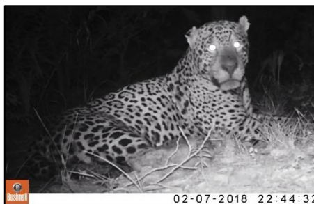
Imagem 02 - Houdini , a onça com mais vídeos em janeiro-fevereiro

Como prometido no relatório do mês anterior, começaremos com os resultados das 73 armadilhas fotográficas (AF's) da marca Bushnell , obtidas através da parceria com a LOG Nature . Foram 115 vídeos de onças-pintadas de 19 indivíduos diferentes (10 machos e