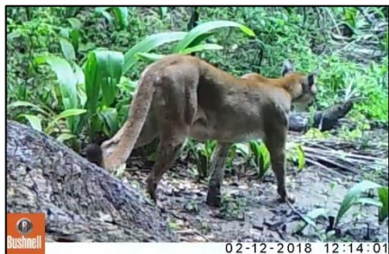
Imagem 04 - Fêmea de puma descendo da árvore

registrada copulando. Das fêmeas monitoradas pelo Onçafari desde 2011, ela é uma das onças mais jovens a apresentar esse comportamento.