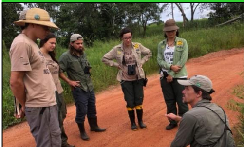
Imagem 01 - Atividade realizada durante o curso de guiagem

Os dois vieram para dar um treinamento a todos os 16 funcionários da Caiman e do Onçafari que tem envolvimento direto com passeios turísticos (guias bilíngues, guias de campo, biólogos e coordenadores). Nesse período, eles puderam compartilhar o conhecimento e a longa experiência em guiagens realizadas pelo mundo e que podem ser aplicadas ou adaptadas à realidade local. Realizaram muitas atividades teóricas e práticas, com a finalidade de capacitar a equipe de turismo e assim oferecer aos hóspedes da Caiman uma experiência marcante e de alto nível no Pantanal.