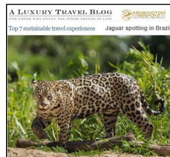
Imagem 07 - Artigo no blog da Luxury Travel

Em fevereiro, a Caiman foi considerada pela Luxury Travel Blog uma das 7 melhores experiências de viagem sustentável do mundo. O REC ganhou destaque principalmente pelo trabalho de habituação e conservação realizado com as onças-pintadas pelo Onçafari, além da hospitalidade, estrutura e gastronomia.