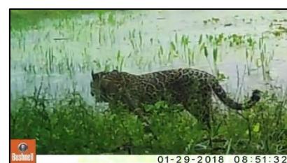
Imagem 10 - Fera passando em beira de açude