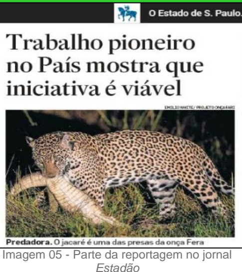
Imagem 05 - Parte da reportagem no jornal Estadão

Na edição do dia 05 de fevereiro do jornal O Estado de S. Paulo foi publicada uma reportagem sobre o Onçafari. O foco foram as duas onças-pintadas reintroduzidas na Caiman em 2016. Teve destaque todo o processo bem-sucedido de adaptação da Isa e da Fera em vida livre. Com a reintrodução das duas irmãs pelo Onçafari, o texto lançou uma perspectiva promissora para o Proyecto Iberá , na Argentina, que pretende reintroduzir a espécie em um local onde as onças-pintadas foram localmente extintas.