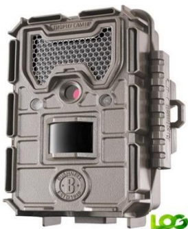
Imagem 02 - Uma das AF's da Bushnell

No início de janeiro, 19 armadilhas fotográficas (AF's) da marca Bushnell fornecidas pela LOG Nature , foram distribuídas no campo. Após determinado período, elas foram retiradas e seus resultados foram organizados e colocados em planilhas. No total, 29 vídeos de onças-pintadas foram filmados pelas AF's. Os indivíduos registrados foram: Zico (11), Esperança (06), Pandhora (05) e Sombra (04). Em três vídeos não foi possível identificar as onças 1 . Chama a atenção a frequência com que o Zico foi flagrado pelas nossas AF's, principalmente na região da Sede da fazenda, onde ele não aparecia desde meados de 2016. Ele foi flagrado pela equipe acasalando com a Esperança , outra onça-pintada que também foi registrada nesse mês pelas nossas AF's. A partir do dia 19 de janeiro, 73 armadilhas fotográficas foram distribuídas em estradas, trilhas e árvores da Caiman. Mas os resultados delas serão conhecidos apenas em fevereiro. No mês que vem, destacaremos os registros mais importantes.