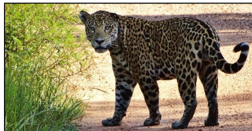
Imagem 03 - Zico , a onça mais avistada em janeiro

O Refúgio Ecológico Caiman (REC) está passando por uma das maiores cheias dos últimos anos. Com a maior parte da fazenda alagada, as atividades de campo ficam