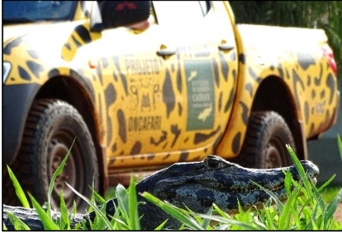
Imagem 04 - Jacaré-do-pantanal, uma das presas mais predadas pelas onças

onças-pintadas no REC tendem a preda jacarés com uma frequência maior se comparada com outras espécies de presas.