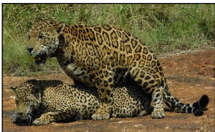
Imagem 03 - Sombra e Isa copulando

Nusa e Juju juntas (01), Felino , Nusa e Juju juntos (01), Pandhora (01), Natureza (01), Nusa (01), Brutus e outra onça não identificada juntos (01). Em seis vezes os indivíduos não foram identificados. A Isa e o Sombra ficaram em comportamento de